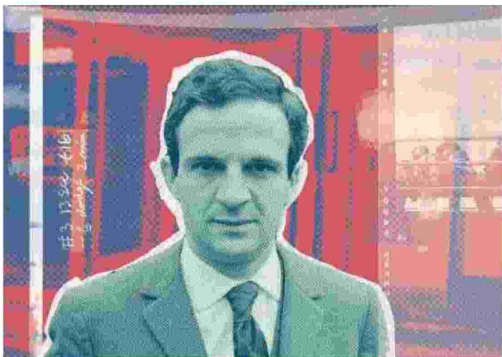
Tra i più significativi epistolari, ecco "Autoritratto", lettere di François Truffaut, Einaudi (elaborazione grafica di Enrico Ciochetti)

Ritaglio stampa ad uso esclusivo del destinatario, non riproducibile.