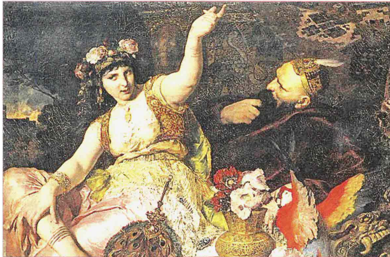
“Sheherazade racconta le sue storie al re persiano Shahriyar” dipinto di Ferdinand Koller (1880). A destra, un’edizione a fumetti delle “Mille e una notte”