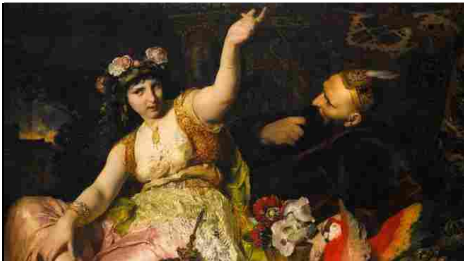
Sheherazade e il sultano Schariar, di Ferdinand Keller (1880)

ESATTAMENTE lì, nel punto in cui si incrociano il cartone animato Aladino della Disney e la suite sinfonica di Rimskij-Korsakov, Il ladro di Bagdad con Douglas Fairbanks e Il fiore di Pasolini, esattamente lì vivono da secoli e secoli Le mille e una notte. Originaria dell'India e con antenati persiani, la raccolta di novelle orientali di vari autori, di origine egiziana e mesopotamica, è diventata celebre grazie a una versione araba della fine dell'VIII secolo/inizio del IX. Tradotta per la prima volta in francese da Antoine Galland fra il 1704 e il 1717, è oggi tra le opere più lette al