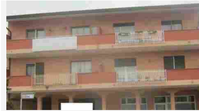
Appartamenti Fogliano Redipuglia ROMA - 49500