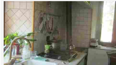
Appartamenti San Michele del Carso, Via Cotici - 41625

Tribunale di Gorizia Tribunale di Trieste